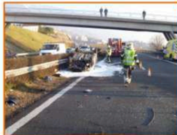
Pollution suite accident, autoroute A9

Et puis bien sûr, la vie de tous les jours, avec son lot de casse, d'échanges de matériel, d'exercices. Mais surtout l'accomplissement de la mission principale, comme vous pourrez le constater au verso de ce bulletin, avec plus de 160 missions accomplies par vos soins.